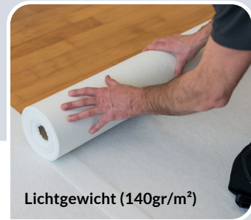
Lichtgewicht (140gr/m 2 )

2m x 50m # 900010 | 1m x 50m # 900271 | 1m x 25m #900275 | 0,65m x 25m # 900276