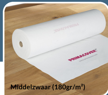
Middelzwaar (180gr/m 2 )

2m x 50m # 900031 | 1m x 50m # 900030 | 1m x 25m #900032 | 0,65m x 25m # 900033