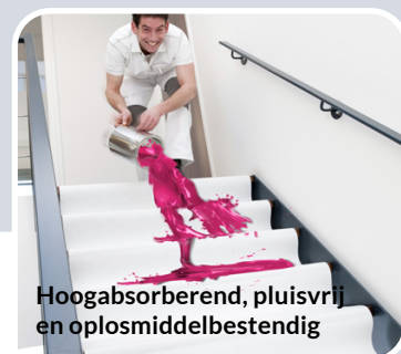
Hoogabsorberend, pluisvrij en oplosmiddelbestendig