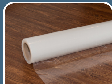
Voor harde ondergronden