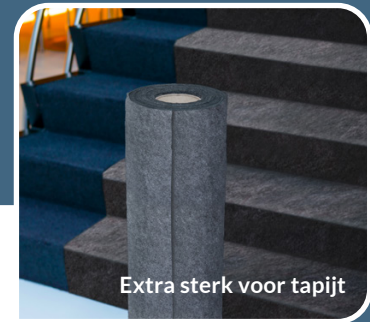
Extra sterk voor tapijt

1m x 50m # 900014 | 0,65m x 50m # 900013