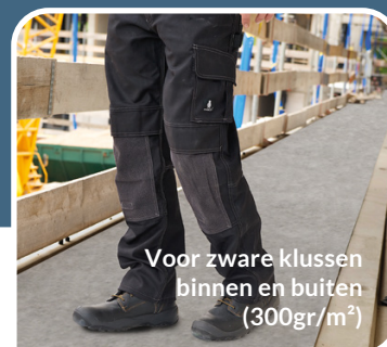
Voor zware klussen binnen en buiten (300gr/m 2 )