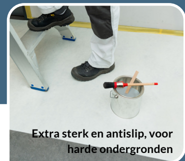
Extra sterk en antislip, voor harde ondergronden

1m x 50m # 900513 | 1m x 25m # 900514 | 0,65m x 25m # 900515