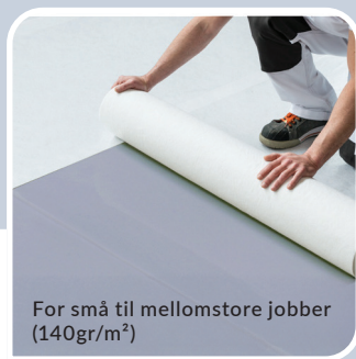
For små til mellomstore jobber (140gr/m 2 )

2m x 50m # 900010 NOBB 56295714 1m x 25m # 900275 NOBB 56296013