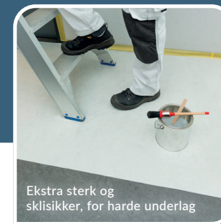
Ekstra sterk og sklisikker, for harde underlag