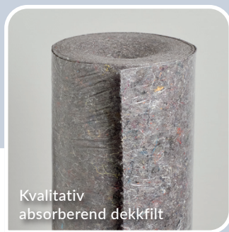
Kvalitativ absorberend dekkfilt

2m x 50m # 900042 NOBB 56295956 1m x 25m # 900043 NOBB 56295960