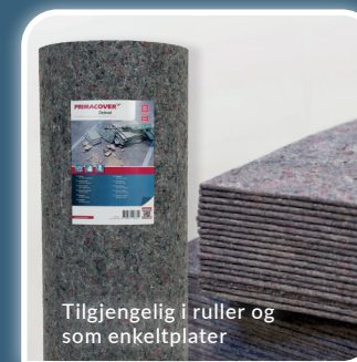
Tilgjengelig i ruller og som enkeltplater

Enkeltplater 0,80m x 1,20m # 900029 NOBB 56295752