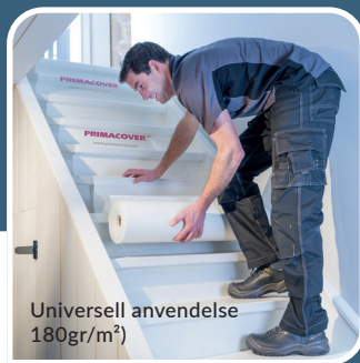
Universell anvendelse (180gr/m 2 )

2m x 50m # 900031 NOBB 56295892 1m x 25m # 900032 NOBB 56295903