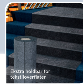
Ekstra holdbar for tekstiloverflater