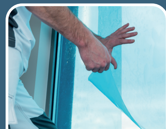
For vindu og glass