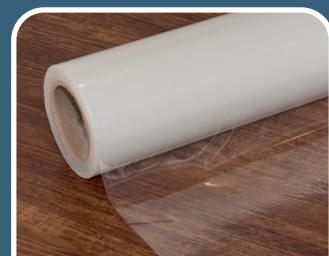
For harde underlag