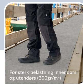
For sterk belastning innendørs og utendørs (300gr/m 2 )