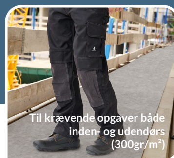
Til krævende opgaver både inden- og udendørs (300gr/m 2 )