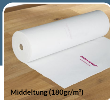
Middeltung (180gr/m 2 )

2m x 50m # 900031 | 1m x 50m # 900030 | 1m x 25m #900032 | 0,65m x 25m # 900033