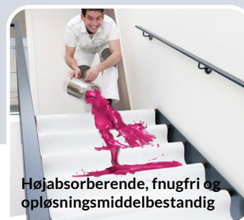
Højabsorberende, fnugfri og opløsningsmiddelbestandig