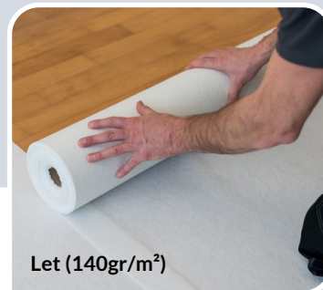
Let (140gr/m 2 )

2m x 50m # 900010 | 1m x 50m # 900271 | 1m x 25m #900275 | 0,65m x 25m # 900276