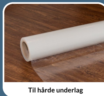
Til hårde underlag