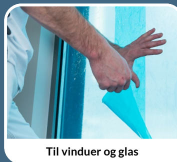
Til vinduer og glas

blå: 1m x 100m # 900578 | 0,50m x 100m # 900020 | 25cm x 100m # 900701 gennemsigtig: 0,50m x 100m # 900611